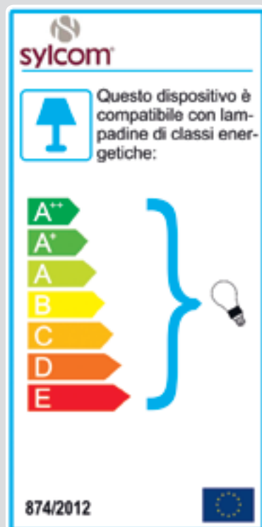
Articoli con attacco Edison E14 - E27