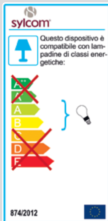
Articolo con attacco 2GX11 - 2GX13 FLUOR.